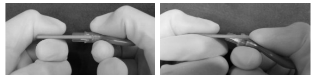
バルブケースカバーは取り外し後、廃棄する。