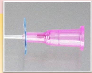
薄くてやわらかい固定板