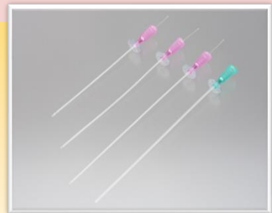
12種類のラインナップ(サイズ構成参照)