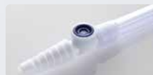
針が不要なニードルレスサンプルポート