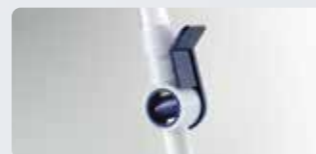
片手で容易に排尿可能なコックハンドル