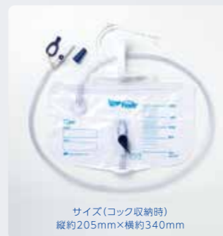
サイズ(コック収納時) 縦約205mm×横約340mm